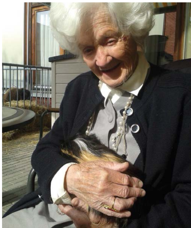
Fotografie Zorgboerderij de Port (Kelpen-Oler)

Hoewel de fysieke omgeving voor een deel bepaalt in hoeverre gewaardeerde elementen van zorgboerderijen toegepast kunnen worden, gaven managers van zorgboerde-