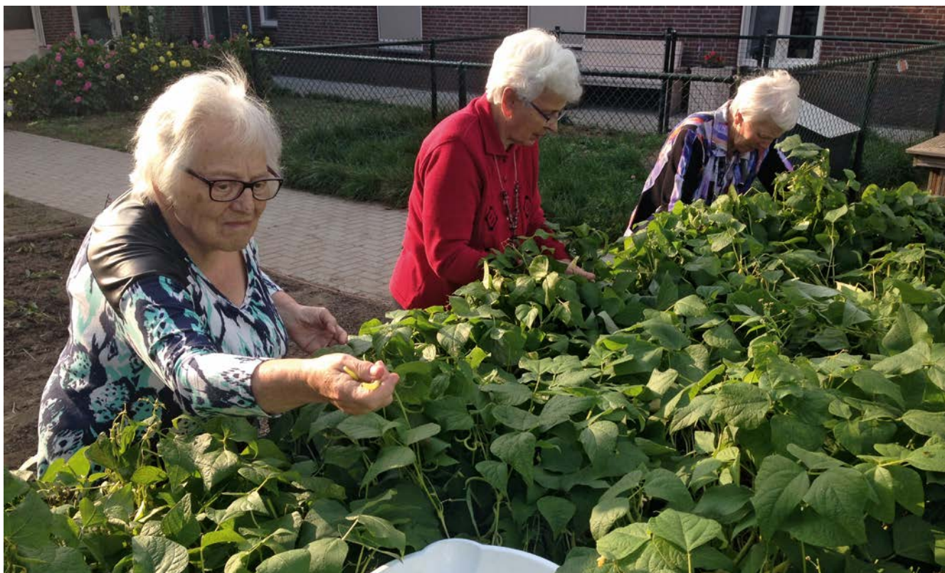
Fotografie Zorgboerderij de Port (Kelpen-Oler)

Om de onderzoeksvragen te beantwoorden gebruikten we verschillende methoden, waaronder analyse van bestaande onderzoeksgegevens over effecten van zorgboerderijen op mensen met dementie, interviews en workshops. Zie Tekstbox 1 en 2 voor informatie over respectievelijk de gehanteerde definities en uitgebreide onderzoeksinformatie. De resultaten worden beschreven aan de hand van dertien kernboodschappen die op de volgende pagina's uiteen worden gezet. Vervolgens doen we een aantal aanbevelingen, gebaseerd op de kernboodschappen, om verschillende belanghebbenden in de dementiezorg te ondersteunen in het beter inspelen op de nog aanwezige capaciteiten, sociale participatie en autonomie van mensen met dementie.