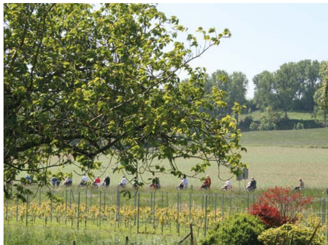
Fotografie Academische Werkplaats Ouderenzorg

In veel reguliere instellingen is er van oudsher vooral aandacht voor de lichamelijke verzorging en verpleegtechnische handelingen en minder voor welzijn, zo blijkt uit interviews met managers van reguliere zorginstellingen. Het is van belang dat het zorgpersoneel bereid is en in staat is om een omslag te maken naar taken die meer gericht zijn op het welzijn van cliënten. Hard werken en een takenlijst afwerken zit soms nog te veel in het systeem van mensen die al lang in de zorg werken. Vrijwel alle managers van zorgboerderijen en enkele managers van reguliere zorginstellingen gaven aan dat binnen hun instelling coachings- en functioneringsgesprekken plaatsvinden waarin de werkwijze en visie worden besproken. Volgens de geïnterviewden kunnen deze gesprekken ook worden ingezet om met zorgpersoneel te praten over het implementeren van alledaagse activiteiten met mensen met dementie in hun werkzaamheden. Managers van zorgboerderijen en van reguliere