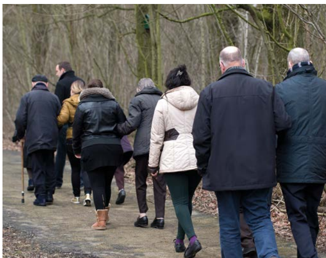
Fotografie Academische Werkplaats Ouderenzorg

reflecteren op het eigen handelen en elkaar aanspreken zonder dat dit als kritiek ervaren wordt. Om autonomie en sociale participatie van mensen met dementie te stimuleren is het van belang dat medewerkers het goede voorbeeld geven door zelf mee te helpen, activiteiten voor te doen en samen met mensen met dementie te werken in plaats van taken over te nemen. Dit betekent dat er een sfeer moet zijn waarbij men zoekt naar mogelijkheden en niet blijft hangen in barrières. Dit kan door gezamenlijk (vanuit management, medewerkers, familie, mensen met dementie) op zoek gaan naar creatieve ideeën en oplossingen.